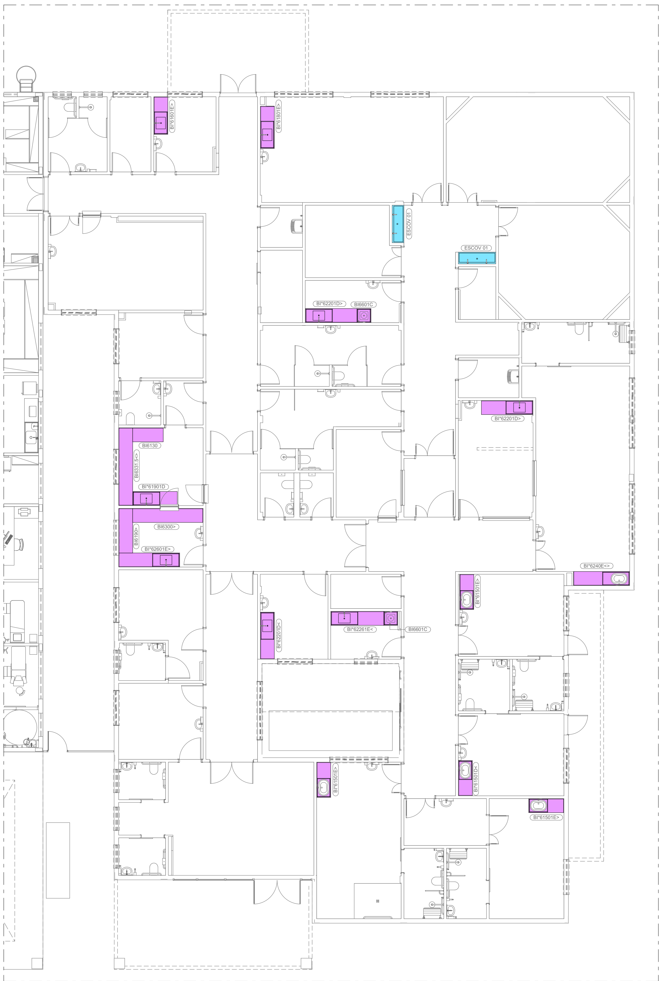
BONECO DE LOCALIZAÇÃO - BANCADAS ESC: 1:100